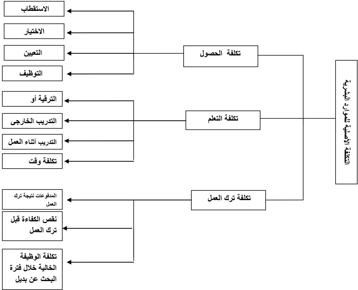
شكل رقم ( 2.2 )

يمكن توضيح التكلفة الأصلية للموارد البشرية كما هو موضح في الشكل رقم ( 2.2 ):